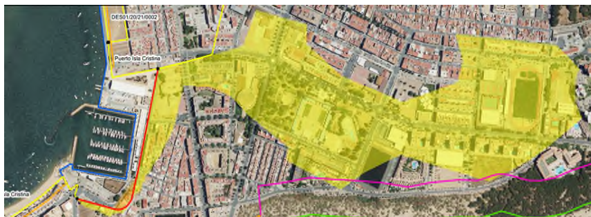
Línea de deslinde propuesta en rojo. En amarillo los terrenos cedidos al Ayuntamiento de Isla Cristina