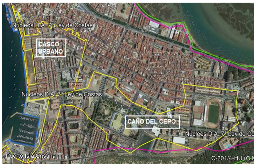
Captura donde se aprecia el Casco Urbano de Isla Cristina y la zona denominada "Caño del Cepo"

IV) Analizada la diferente documentación obrante en el expediente, se deduce de la descripción de la parcela, que los terrenos desafectados se podrían corresponder sensiblemente con el citado núcleo denominado Caño del Cepo, de Isla Cristina, lo que en la práctica supondría la exclusión del demanio de la superficie determinada.